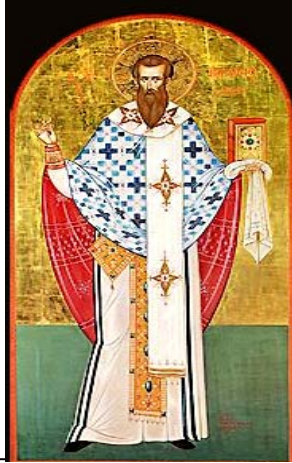
غريغوريوس الناطق بالالهيات

ولد من عائلة مسيحية أرستقراطية، وكان مولعاً بالدراسة، فغادر إلى الإسكندرية وإلى أثينا لطلب العلم. نال سر المعمودية من والده أسقف مدينة نزينزا .